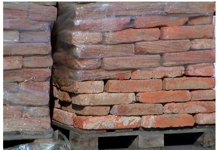
Lagerung zum Abtransport auf Paletten (max. 100 kg bzw. 250 bis 300 Stk)